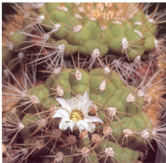
Gymnocalycium chacoense

G. catamarcense a fait ses débuts après la publication de mon livre en 1994. Il a été décrit dans la publication autrichienne sur les Gymnocalycium (Till, 1995), avec deux sous-espèces, ssp. acinacispinum et ssp. schmidianum , remplaçant G. hybopleurum dans la conception de Backeberg. Il a récemment été remplacé, sans reconnaissance de ses deux sous-espèces, sous G. pugionacanthum , reconnu comme étant un ancien nom de G. catamarcense , donc nous en saurons plus lorsque nous en serons à la lettre 'P'.